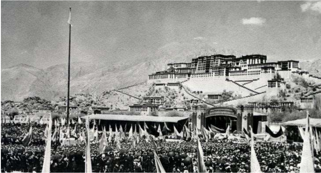
Tibeťané se při povstání proti čínské nadvládě dne 10. března 1959 shromáždili před palácem Potála

Když je lid utiskován, snadno proti utiskovateli povstane. Až do 50. let 20. století v Tibetu k žádným lidovým povstáním nedošlo. Tibetské hnutí odporu proti Číňanům začalo v době čínské invaze. V roce 1956 vypukly otevřené střety ve východních provinciích Kham a Amdo. O tři roky později již mělo povstání celonárodní rozměry a v březnu 1959 vedlo ve Lhase k rozsáhlým demonstracím. Tibetské demonstrace a další projevy povstání poté pokračovaly.